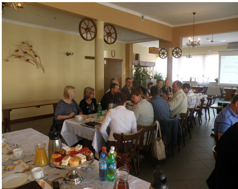
Pierwsze spotkanie grupy roboczej w Restauracji „Tęcza”

Pierwsze spotkanie odbyło się 26 maja 2011 r., z 28 uczestnikami na którym przedstawiono pilotażowy program Ministerstwa Rozwoju Regionalnego w ramach Programu Operacyjnego Kapitał Ludzki „Decydujemy razem”. Zapoznano uczestników z zakresem danych i informacjami niezbędnymi do weryfikacji i aktualizacji Strategii Zrównoważonego Rozwoju Gminy Lipka. Zaprezentowano zakres prac warsztatowych w Gminie Lipka oraz zakresu odpowiedzialności poszczególnych podmiotów biorących udział w projekcie. Przedstawiono również klucz doboru członków grupy warsztatowej.