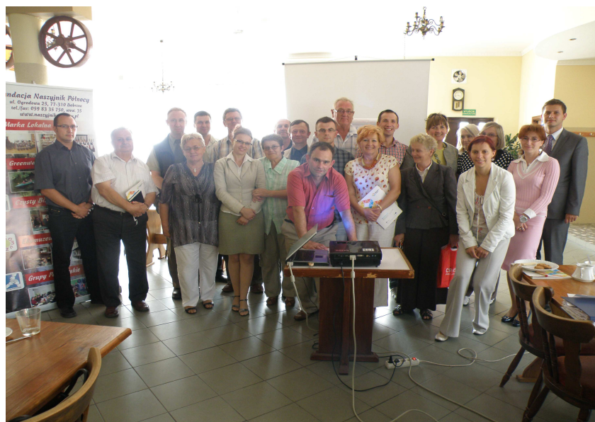
Drugie spotkanie grupy roboczej w Restauracji „Tęcza”

Drugie spotkanie odbyło się 6 lipca 2011 r., w której wzięło udział 30 członków grupy warsztatowej. Na spotkaniu tym omówiono metodologię procesu budowania strategii rozwoju metodą partnerską oraz znaczenie partycypacji społecznej w planowaniu strategicznym.