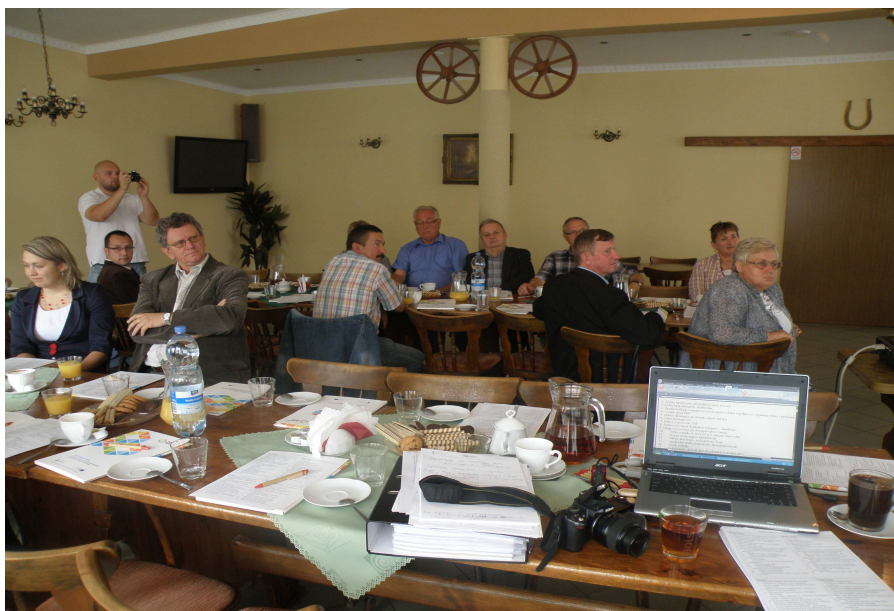
Trzecie spotkanie grupy roboczej w Restauracji „Tęcza”

Trzecie spotkanie grupy warsztatowej odbyło się 7 września 2011 r. na którym przedstawiono charakterystykę Gminy, dane statystyczne oraz sytuację gospodarczą Gminy Lipka. Omówiono wcześniej opracowaną analizę silnych i słabych stron Gminy Lipka oraz dokonano konsultacji w tej sprawie. Przedstawiono propozycje pracy Grupy warsztatowej z podziałem na grupy robocze na następnym planowanym spotkaniu.