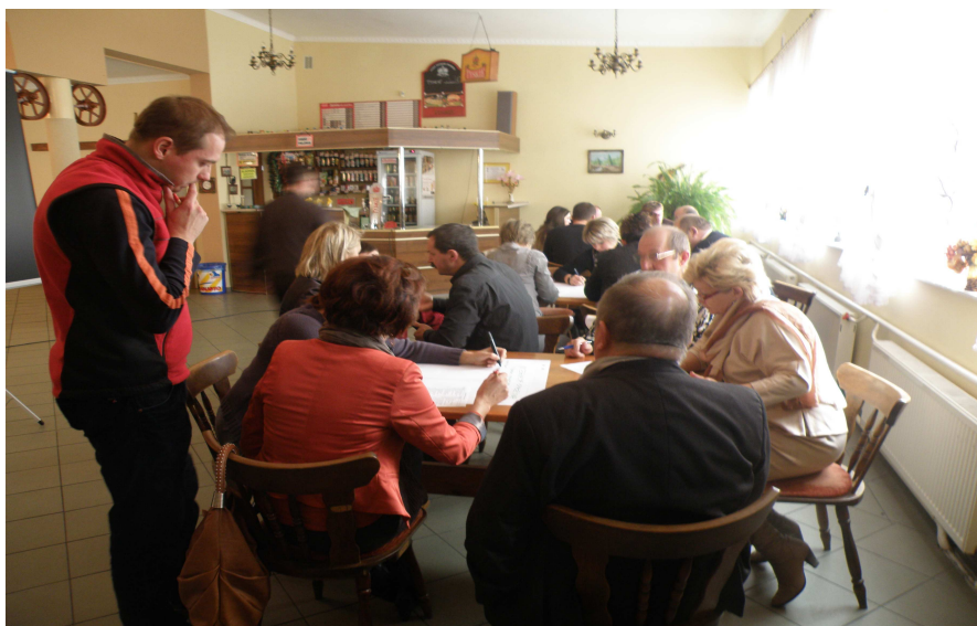
Czwarte spotkanie grupy roboczej w Restauracji „Tęcza”