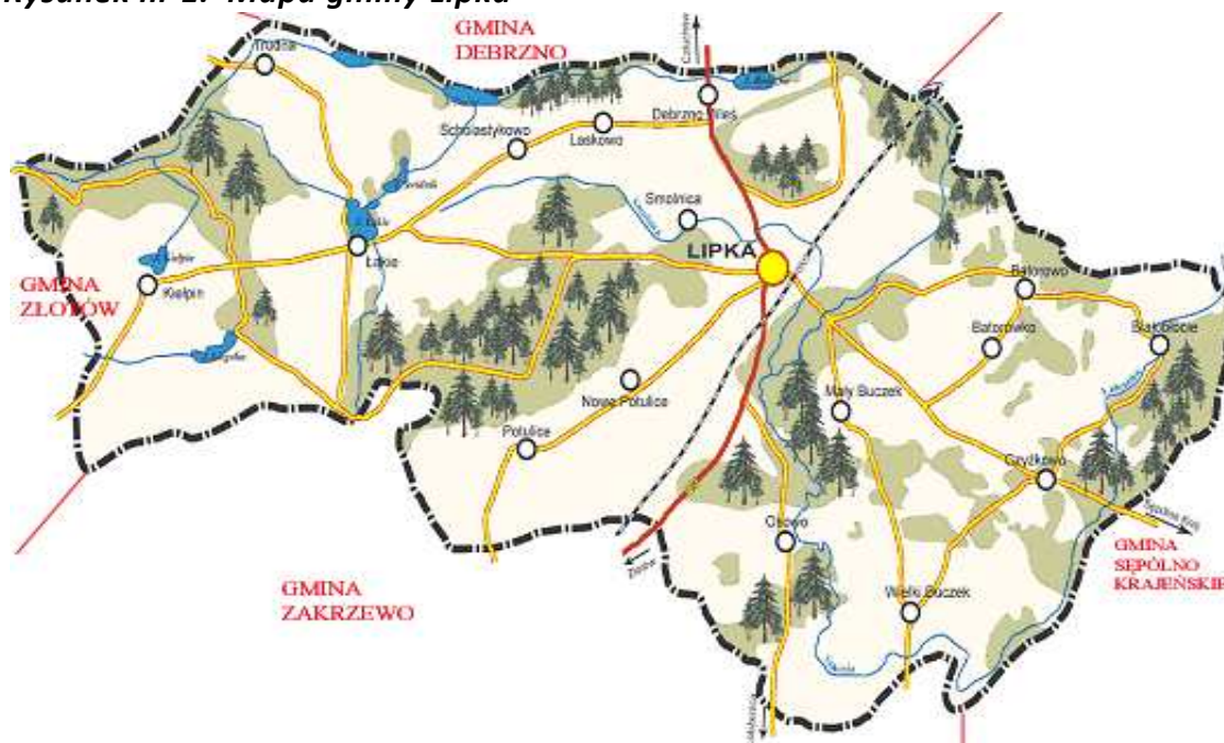
Rysunek nr 1. Mapa gminy Lipka

Pierwsze dostępne dokumenty historyczne wskazują, że historia Lipki rozpoczyna się w 1376 r. W tamtych czasach Lipka istniała jako osada, założona prawdopodobnie w czasach kolonizacji za Kazimierza Wielkiego. Obszar dzisiejszej gminy wchodził kolejno w skład dzielnicy wielkopolskiej, Pomorza Gdańskiego, Prus a także Republiki Weimarskiej.