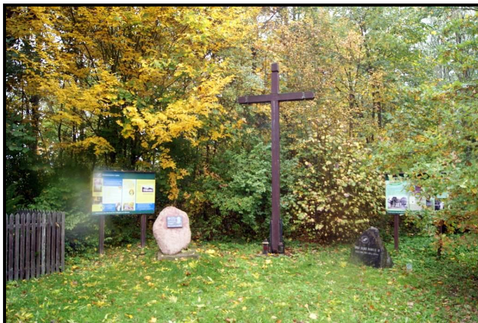
Zabytkowy park - miejsce pamięci