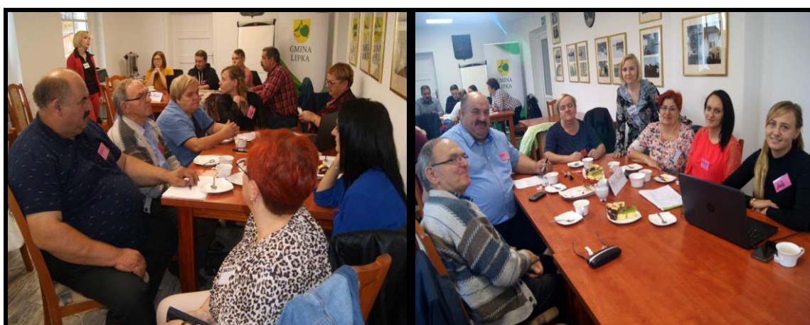
Grupa Odnowy Wsi w czasie warsztatów opracowania Sołeckiej Strategii Rozwoju. Urząd Gminy w Lipce, dnia 18 - 19.X.2019r.