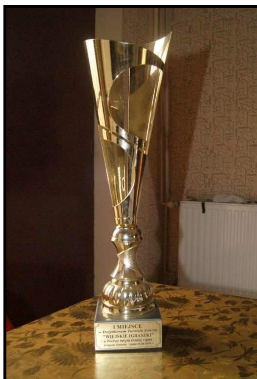
I Miejsce w Dożynkowym Turnieju Sołectw „Wiejskie Igraszki” Dożynki Gminne – Lipka 31.08.2019r.