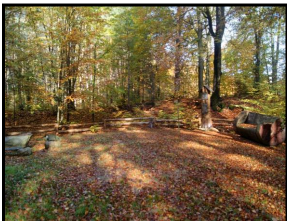
Leśne miejsce spotkań