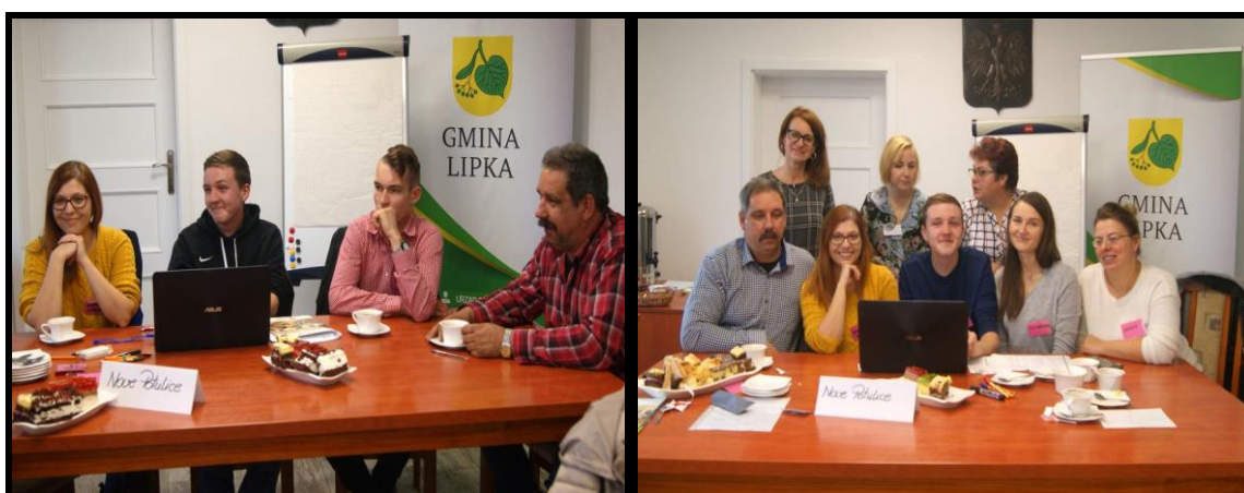
Grupa Odnowy Wsi w czasie warsztatów opracowania Sołeckiej Strategii Rozwoju. Urząd Gminy w Lipce, dnia 18 - 19.X.2019r.