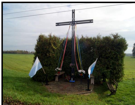
Miejsce kultu religijnego