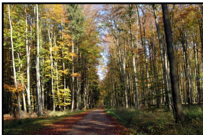
Nowe Potulice i jej walory przyrodnicze