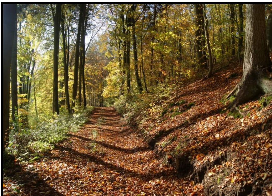
Trudna z pięknymi walorami przyrodniczymi