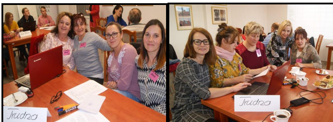
Grupa Odnowy Wsi w czasie warsztatów opracowania Sołeckiej Strategii Rozwoju. Urząd Gminy w Lipce, dnia 18 - 19.X.2019r.