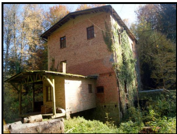
Stary młyn - hotelik