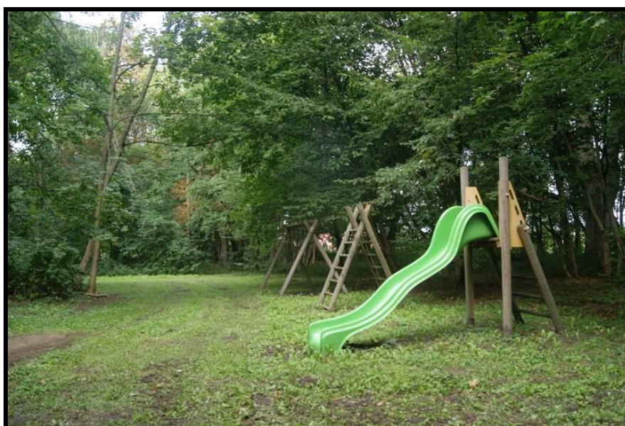
Zabytkowy park z miejscem rekreacji dla najmłodszych