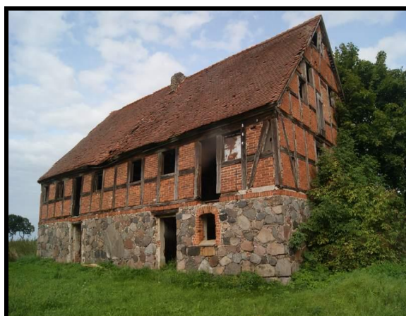
Liczne zabytki i pamiątki historyczne na terenie sołectwa