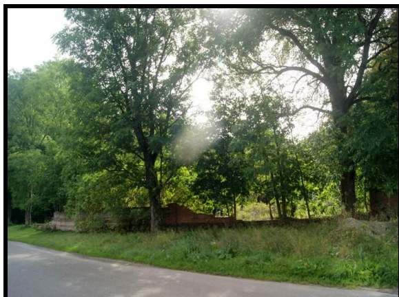
Szczałki muru okalający park z cennym drzewostanem