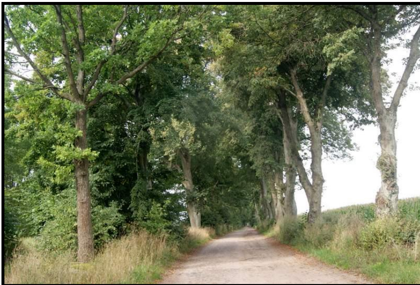
Na terenie sołectwa aleje: lipowe, kasztanowe oraz grabowe