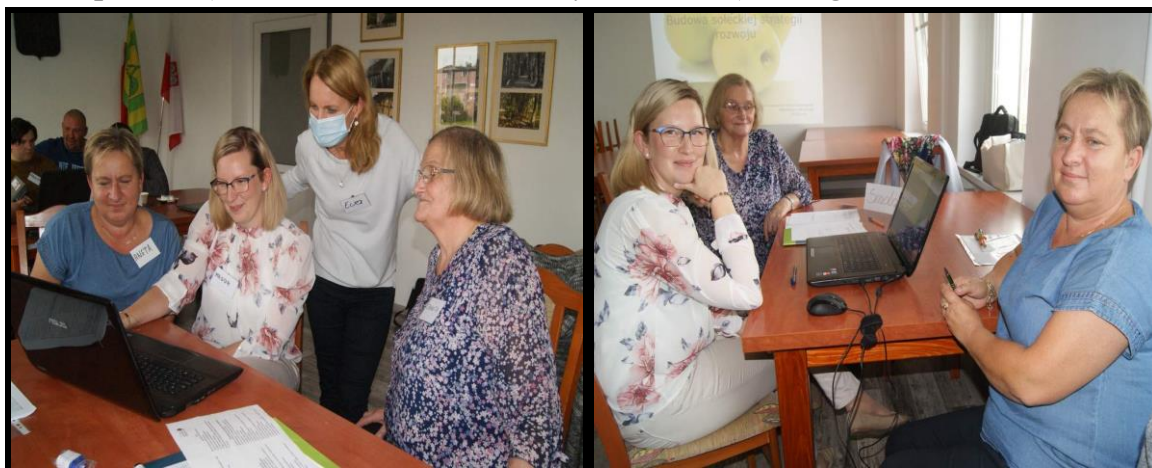
Grupa Odnowy Wsi w czasie warsztatów opracowania Sołeckiej Strategii Rozwoju. Urząd Gminy w Lipce, dnia 11 - 12.IX.2020r.