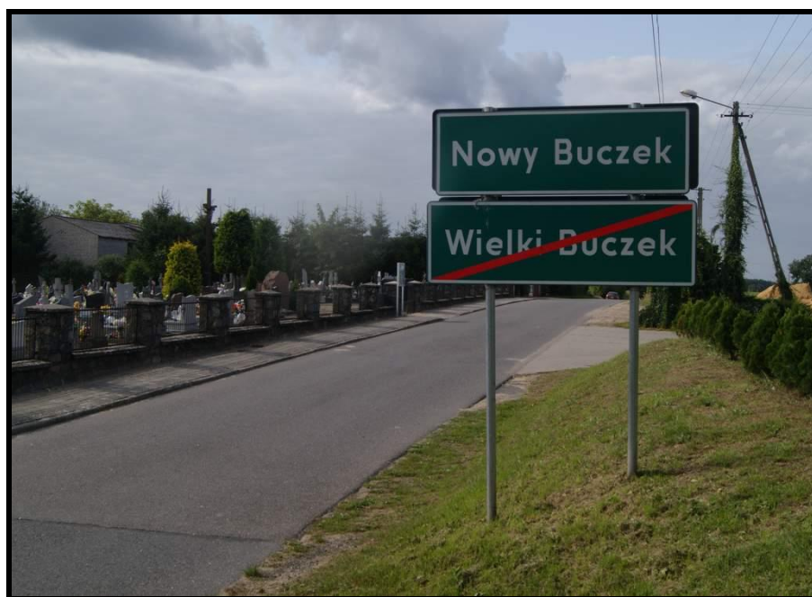
Zintegrowana społeczność Nowego i Wielkiego Buczka