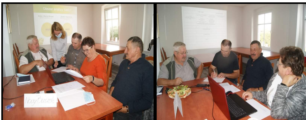
Grupa Odnowy Wsi w czasie warsztatów opracowania Sołeckiej Strategii Rozwoju. Urząd Gminy w Lipce, dnia 11 - 12.IX.2020r.

SOLECKA STRATEGIA ROZWOJU – NOWY BUCZEK wypracowana przez GOW na warsztatach w ramach programu UMWW - „Wielkopolska Odnowa Wsi 2013-2020”