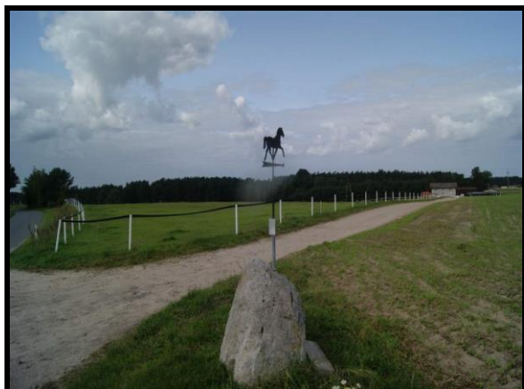
Gosp. Agroturystyczne „U Stasia”