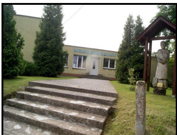
Wiejski Dom Kultury Nowego i Wielkiego Buczka